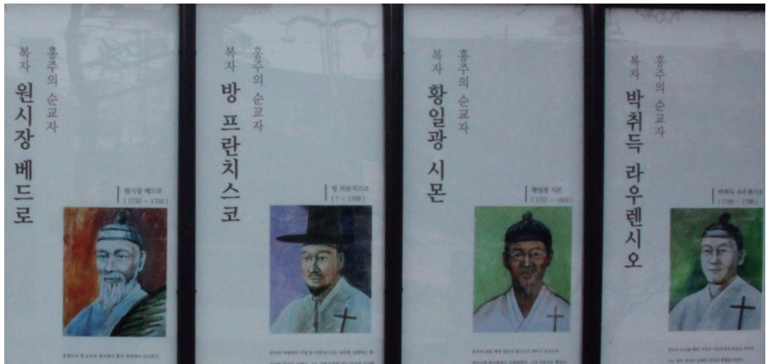
[그림1] 홍주 순교복자 4위(원시장 베드로, 방 프란치스코, 황일광 시몬, 박취득 라우렌시오) [홍주성지]

지난 『상교우서』 86호(2022년 7월호)에서 필자는 순교복자 이도기(바오로), 박취득(라우렌시오), 김세박(암브로시오)에 대한 최초의 교회 측 기록이 모방 신부 서한에서 확인된다고 밝혔습니다. 그중 1799년 홍주에서 순교한 박취득의 출생지를 언급할 때 전거 자료를 잘못 인용했고, 다블뤼 주교의 기록 중 빠뜨린 내용이 있다는 것을 알게 되었습니다. 이번 『상교우서』 지면을 통해 필자의 잘못을 바로잡고 관련 자료를 다시 정리해서 소개하고자 합니다.