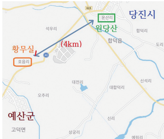
[그림3] 홍주 원당산[현 당진시 합덕읍 운산리]과 덕산 황무실[현 예산군 고덕면 호음리]

1859년 다블뤼의 보고서에 나오는 홍주 ‘Ouen-tang-san’(원당산)은 현재 당진시 합덕읍 운산리로 추정되며, 모방 신부의 1836년 12월 9일자 서한에 나오는 충청도 ‘Houangmusil’(황무실)[현재 충남 예산군 고덕면 호음리. 조선시대에는 덕산군 고산면에 속했는데 1914년에 예산군에 편입됨]과는 서로 다른 박취득 출생지임을 확인할 수 있습니다. 그런데 실제 지도를 보면, 현재 운산리[원당산]와 호음리[황무실]는 4km 정도 떨어진 가까운 지역이라는 것을 알 수 있습니다. 모방 신부와 다블뤼 주교는 다른 시기에 다른 자료를 입수하여 기록에 남겼는데, 두 기록에 나오는 박취득의 출생지가 서로 가까운 지역이라는 점이 특이합니다.